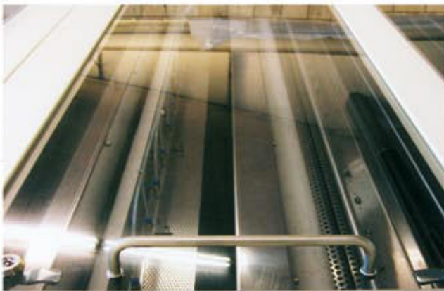
Maschinenabdeckungen und Maschinenverkleidungen

als Splitter-, Durchschlag- und Durchstoßschutz, aber auch als Spritzschutz, Lärmschutz, Strahlenschutz und Staubschutz.